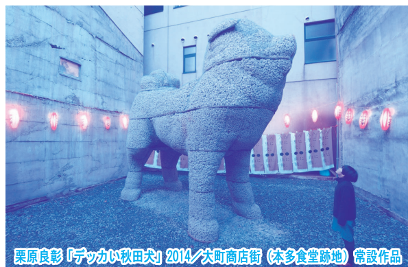
栗原良彰「フックイ秋田犬」2014/大町商店街(株多食堂跡地) 常設作品

当日は大館市公式ツイッターでイベント情報を発信！ 大館市公式アカウント odate_city